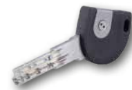
npr. Art. SE30 Mehatronički ključ