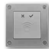
Art. E231 Zidni čitač