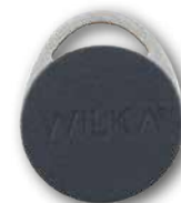
Art. E891 Elektronički tag